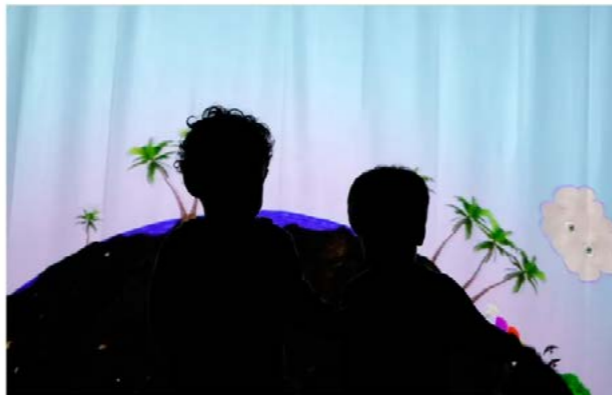
Fibita para los m3s peques: se estrena ¡Oh, uh, ah, ei! Tierra-Aire-Fuego-Agua, una instalaci3n audiovisual para ni1os de 1 a 5 a1os