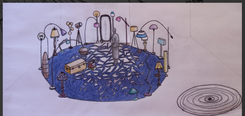
BOCETO ESCENOGRAFÍA "A QUE VOY YO Y LO ENCUENTRO"

Desde el 2009 forma parte de la compañía Beluga Teatro, con la cual ha co-creado y diseñado cuatro montajes para público adolescente. Ha trabajado como diseñadora de escenografía, vestuario e iluminación en Grecia y en España con diversas compañías de teatro y danza como Teatro Municipal de Kavala, Fundación Siglo de Oro, Proyecto 43-2, Teatro en Vilo, Centro Dramático Nacional, Zukdance Performing Arts y Teatro la Abadía, entre otras. Especialista en creación de máscaras profesionales para teatro, imparte talleres en la Escuela Internacional del Gesto.