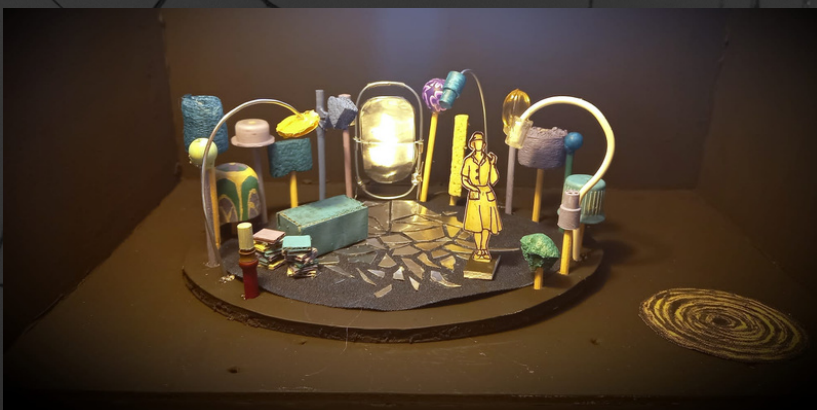
MAQUETA ESCENOGRAFÍA "A QUE VOY YO Y LO ENCUENTRO"